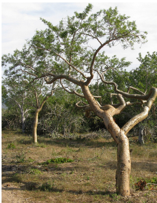
TOROTE. (Bursera sp)