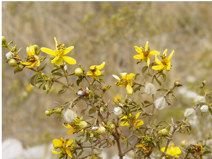
GOBERNADORA. ( Larrea tridentata )

http://farm1.static.flickr.com/69/153253781_22864180e1.jpg