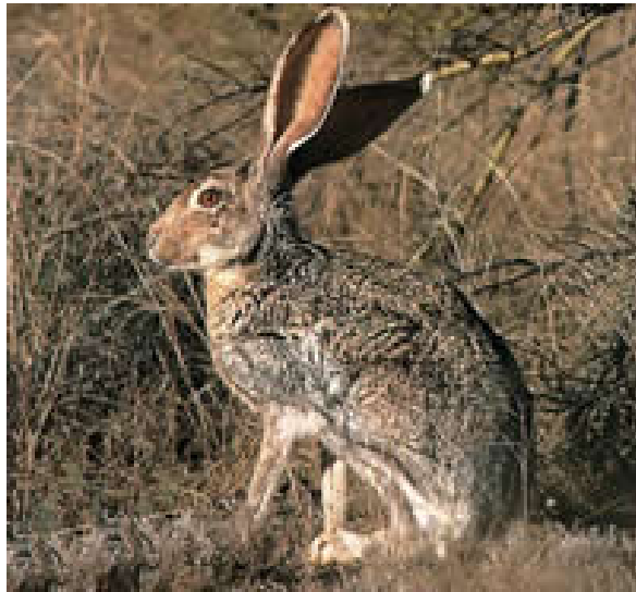
LIEBRE ( Lepus Callotis )