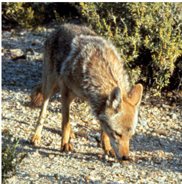
COYOTE ( Canis latrans )