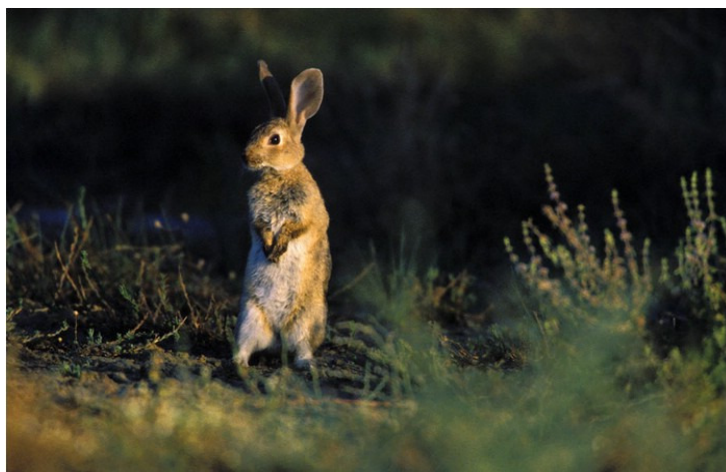
CONEJO ( Oryctolagus cuniculus )