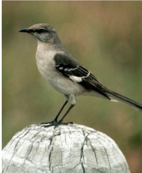
CENZONTLE ( mimus polyglottos )