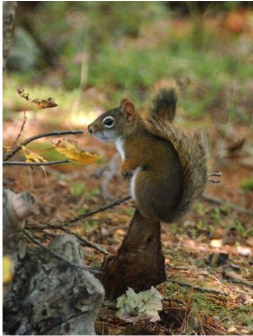
ARDILLA ( Tamiasciurus hudsonicus )