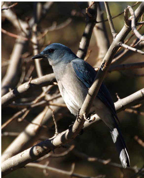
PAJARO AZUL ( Aphelocoma ultramarina )