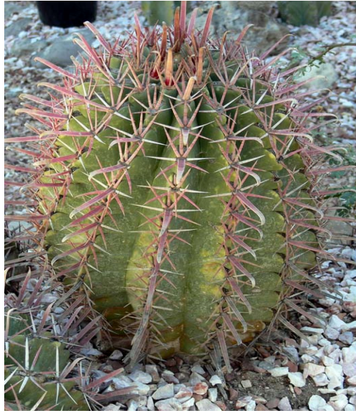
BIZNAGA. ( Ferocactus latispinus )