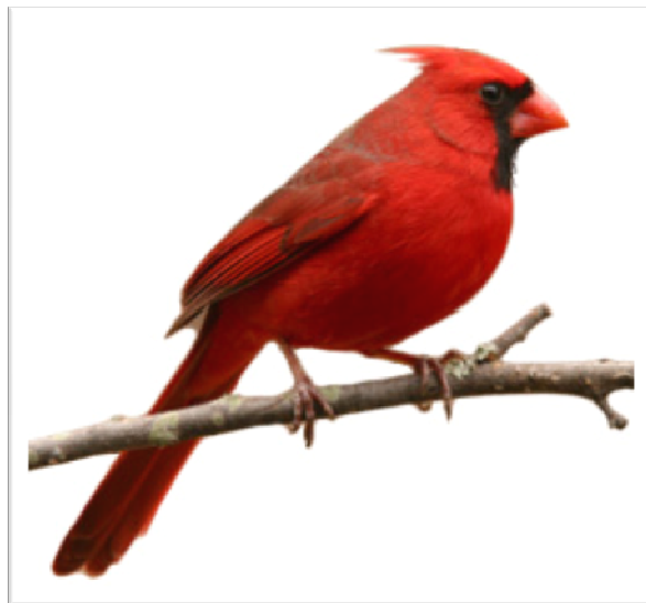
CADERNAL ( Cardinalis cardinalis )