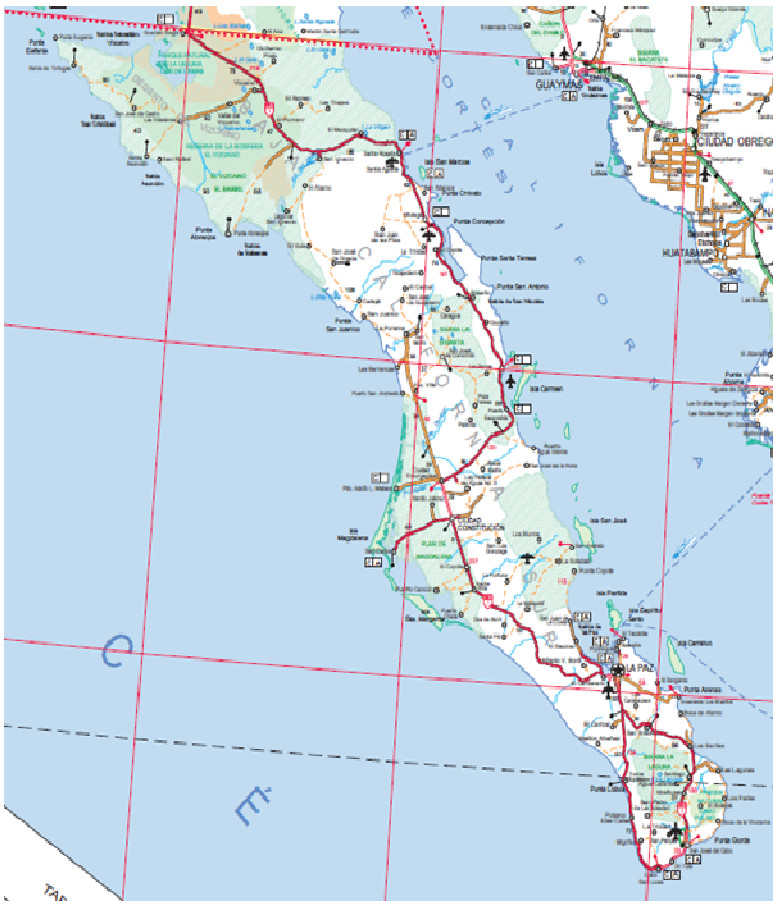
Figura 1. Macrolocalización. Estado de Baja California Sur. México.