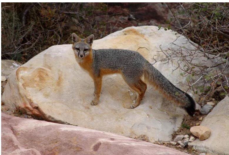
ZORRO GRIS ( Urocyon cinereoargenteus )