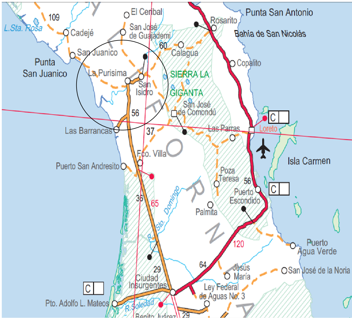
Figura 2. Región central de Baja California Sur. San Isidro - La Purísima, B.C.S.