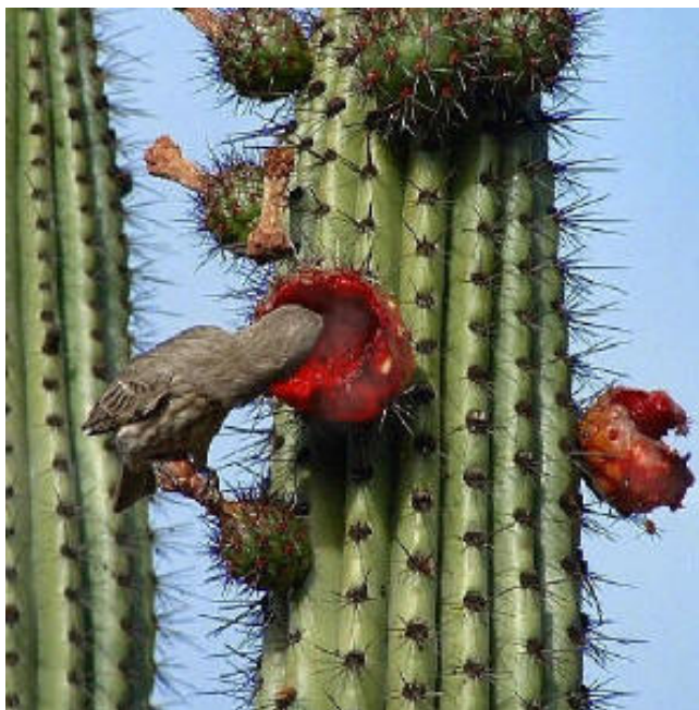
PITAHAYA DULCE. (Stenocereus thurberi)