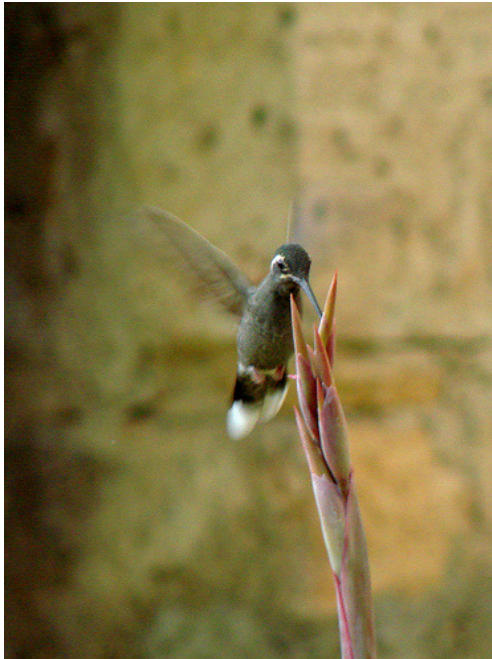
COLIBRI ( Selasphorus platycercus )