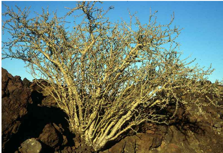
MATACORA. ( Jatropha cuneata )

http://www.desertmuseum.org/programs/images/Jatcun06.jpg