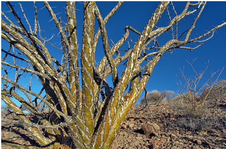
PALO ADAN. ( Fouquieria diguetii )

http://www.desertmuseum.org/programs/images/Jatcun06.jpg