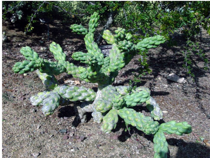
CHOYA PELONA. ( Opuntia cholla )