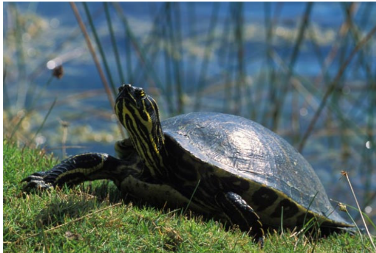
TORTUGA DE OASIS ( Peninsula Cooter )