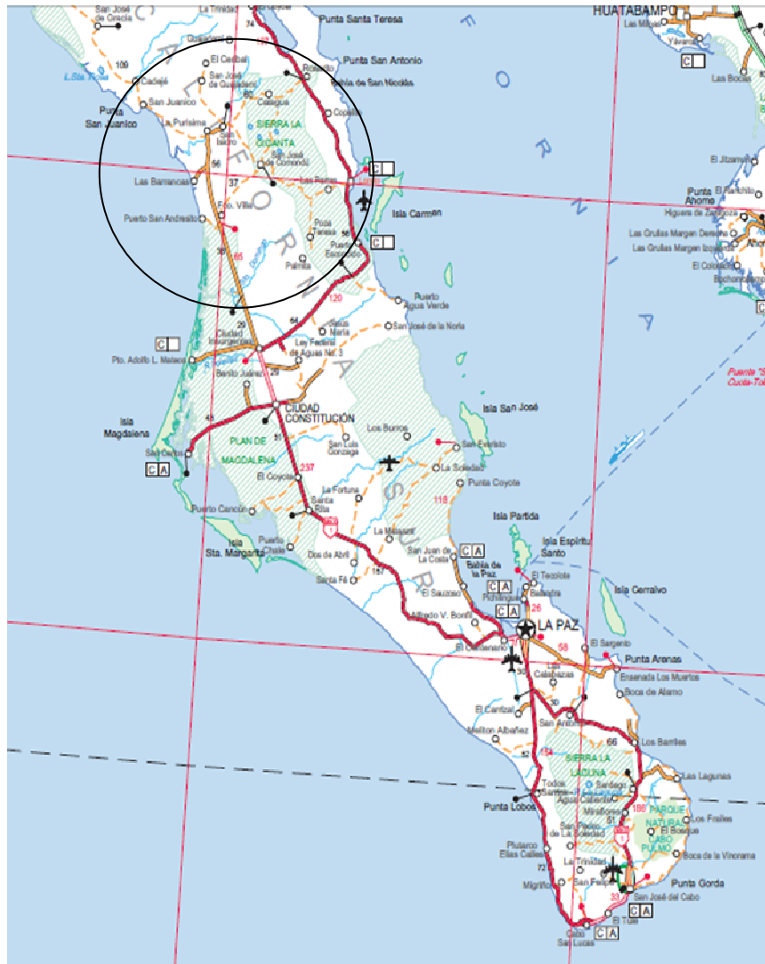
Figura 2. Región central de Baja California Sur.