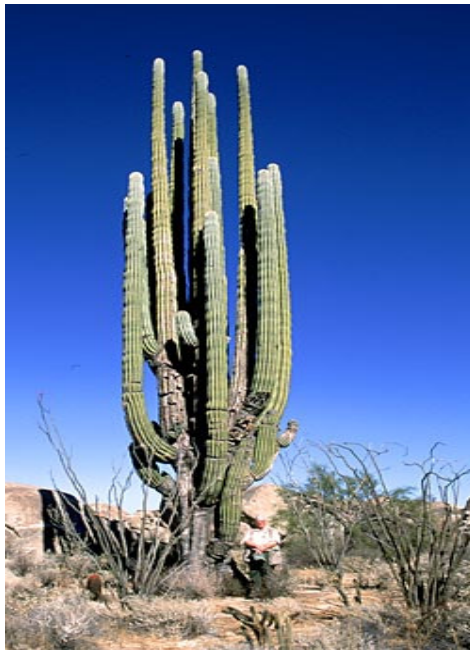
CARDON. ( Pachycereus pringlei )

http://www.oceanoasis.org/fieldguide/images/cardon-70-dc.jpg