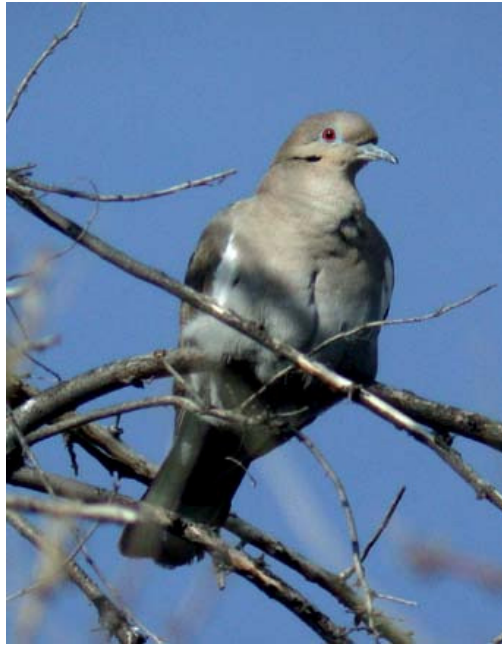
PALOMA DE ALA BLANCA ( Zenaida asiatica )