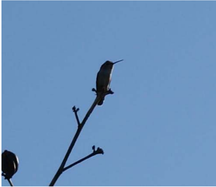
Colibrí de Costa ( Calypte Costae )