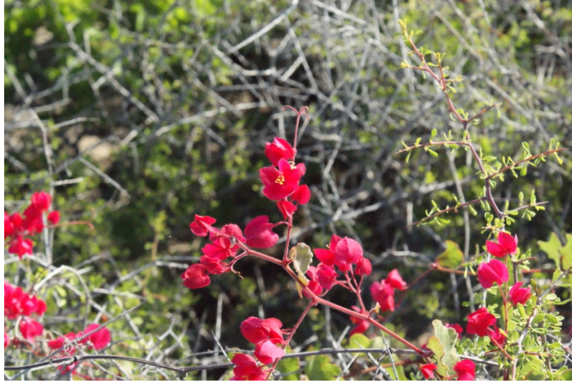
San Miguel ( Antigonon leptopus )