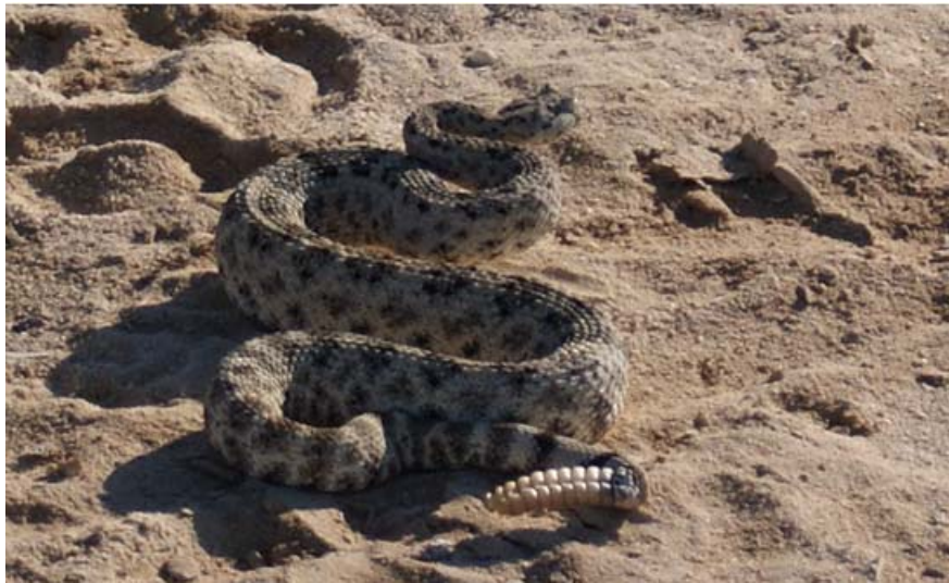
Cascabel ( Crotalus ruber )