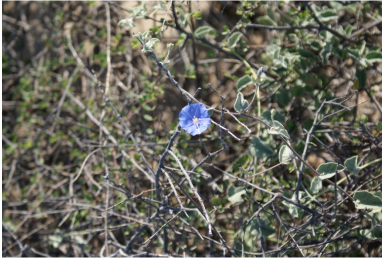
Campanilla ( Jaquemonthia abutiloides )