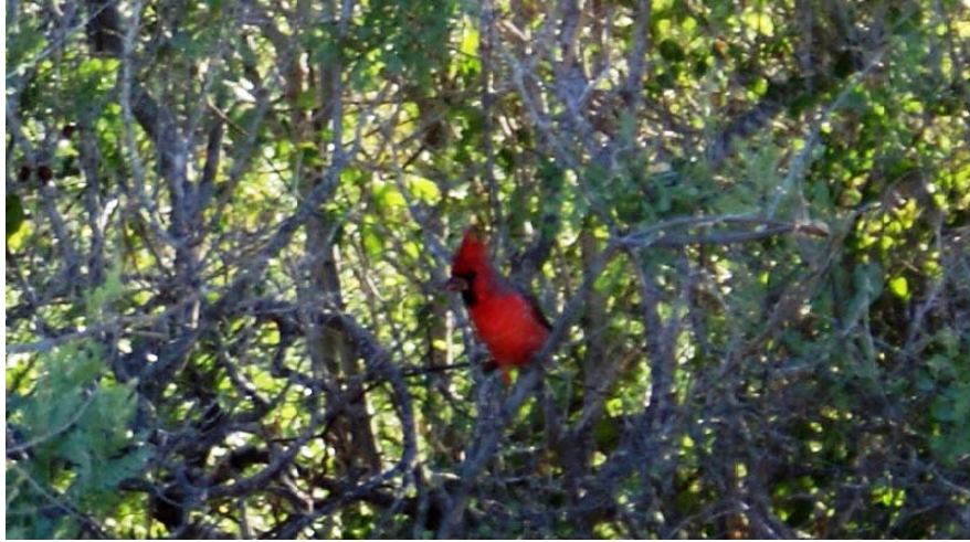
Cardenal ( Cardinalis cardinalis )