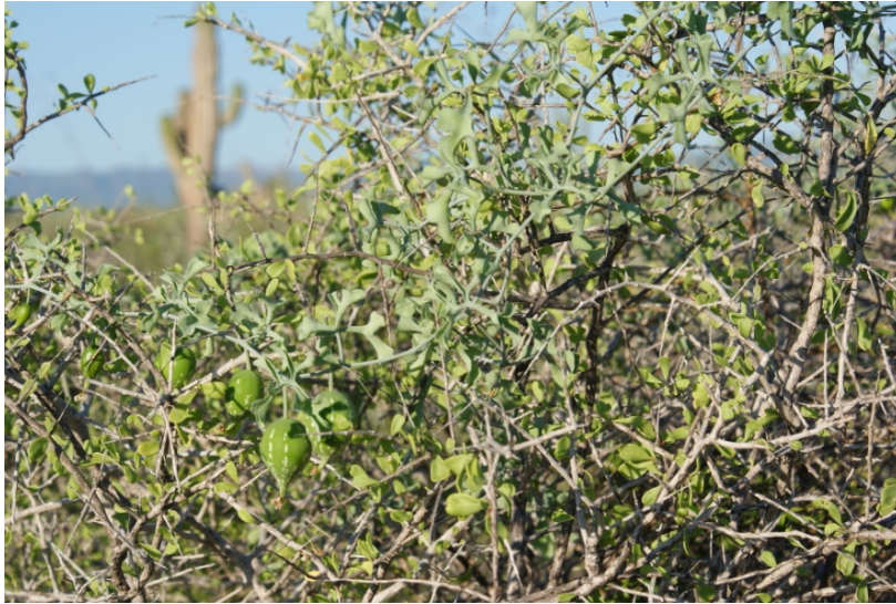
Coyote melón ( Cucurbita palmata )