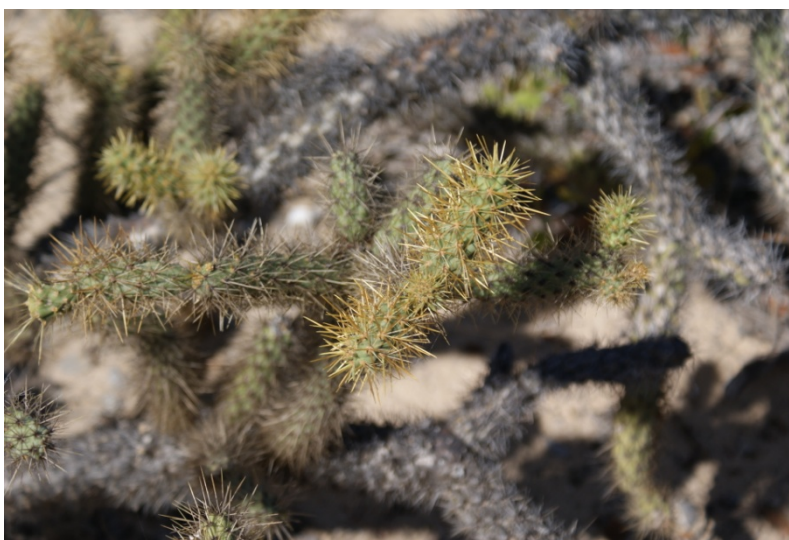
Choya clavelina ( Opuntia molesta )