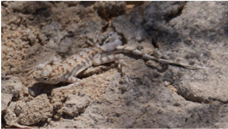
Lagartija cola de cebra (Callisaurus draconoides)