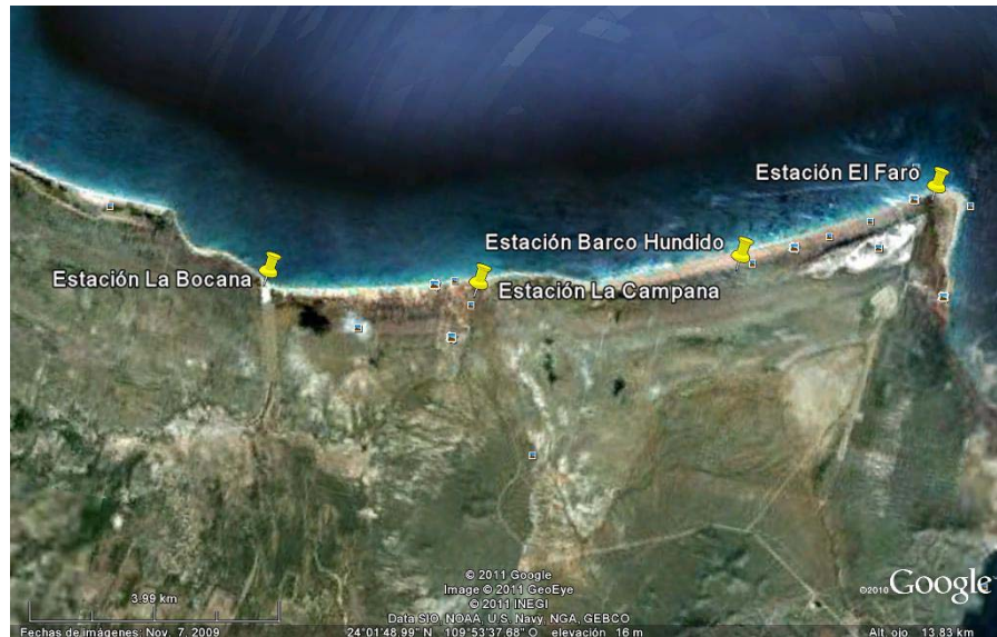
Fig.- 3 Imagen Satelital (Google) del área de estudio y los puntos de muestreo.