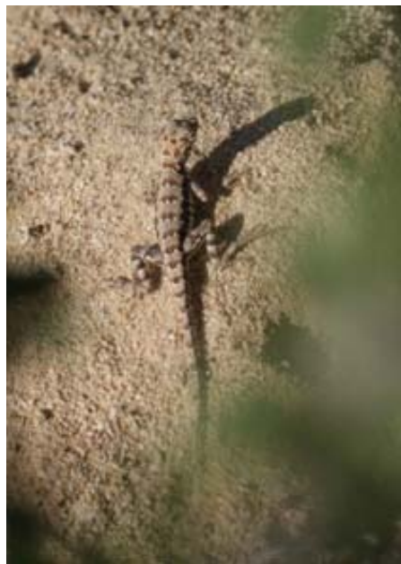
Lagartija cola de cebra (Callisaurus draconoides)