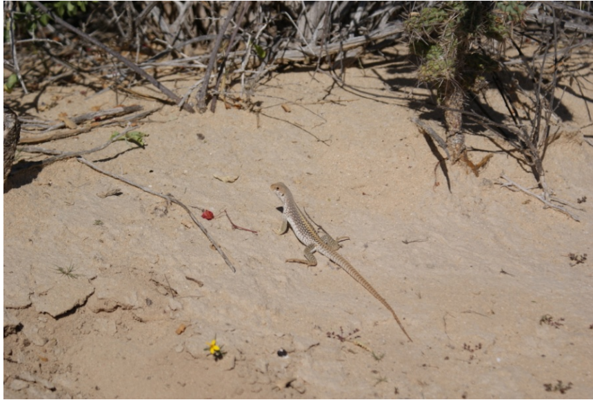
Iguana del desierto ( Dipsosaurus dorsalis )