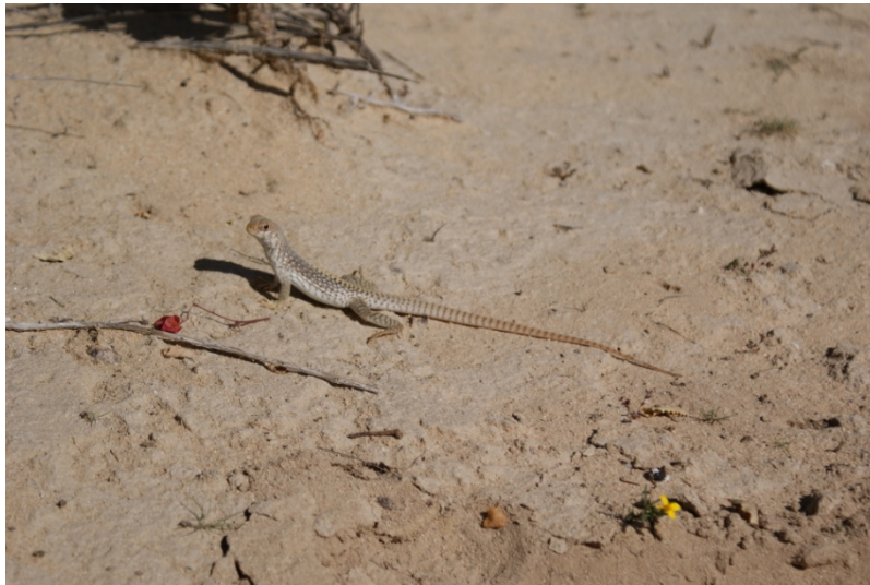
Iguana del desierto ( Dipsosaurus dorsalis )