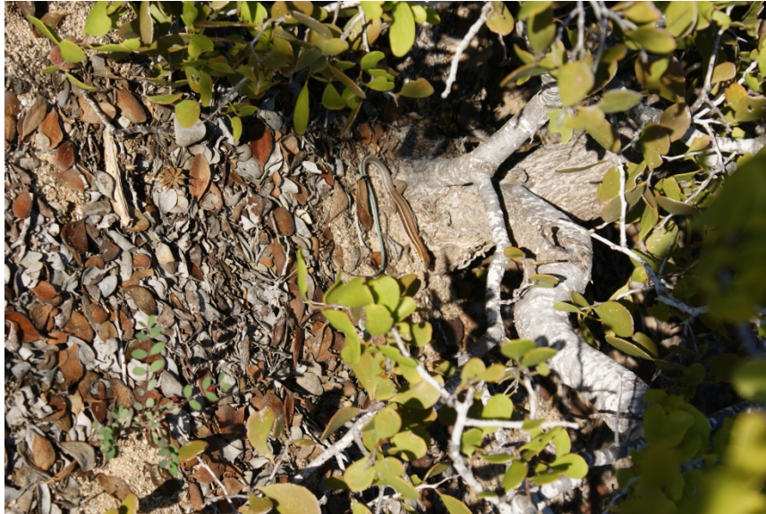
Lagartija cola de látigo ( Cnemidophorus sp. )