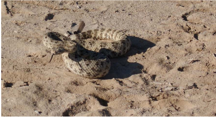
Cascabel ( Crotalus ruber )