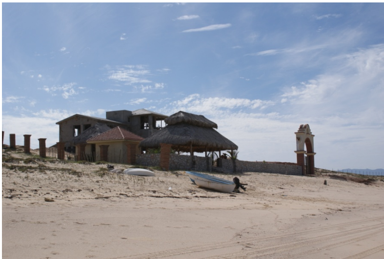
Construcción de viviendas y desmonte de terreno.