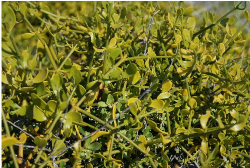
Mangle dulce ( Maytenus phillacanthoides )