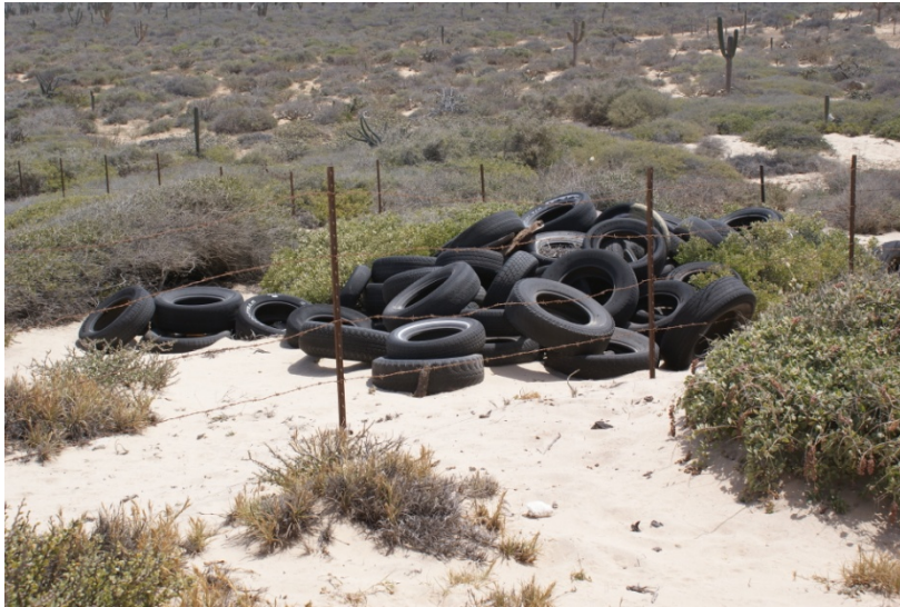
Tiradero de llantas