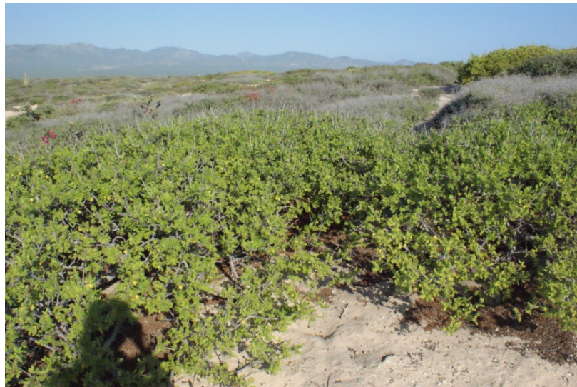
Ciruelo cimarrón ( Cyrtocarpa edulis )