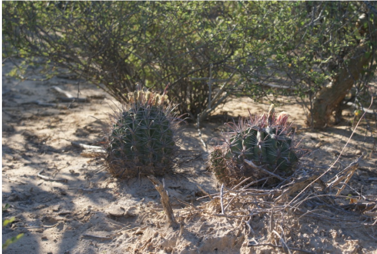
Biznaga ( Ferrocactus towsendianus )