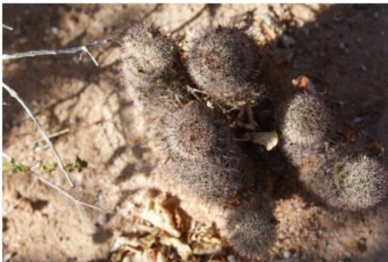
Viejito ( Mamillaria sp )